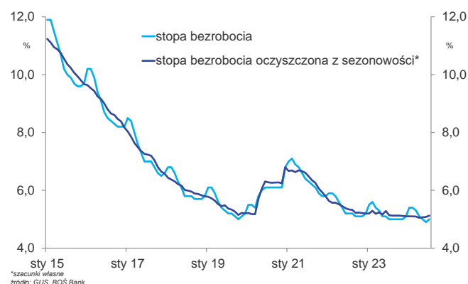
Sezonowość stopy bezrobocia